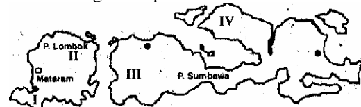
Nusa Tenggara Barat